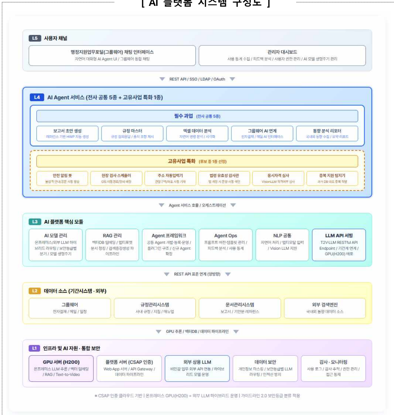
[ AI 플랫폼 시스템 구성도 ]